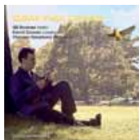
Edward Elgar Violinkonzert Gil Shaham, David Zinman ★★★★☆