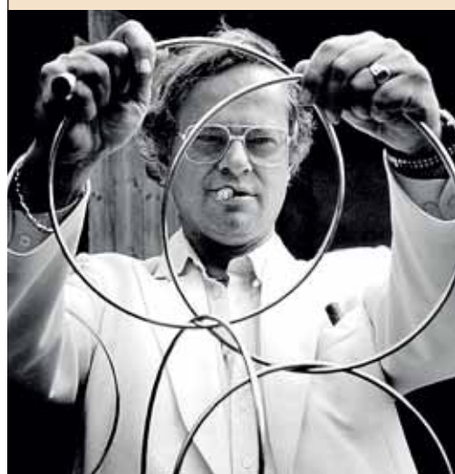
Hermann Burger mit Zauberringen

Vor zwanzig Jahren nahm sich Hermann Burger, eine der schillerndsten Figuren der Schweizer Literatur im ausgehenden 20. Jahrhundert, das Leben. Sein Interesse galt den Aussenseitern der Gesellschaft, die er als Einzelgänger würdigt. Dieses Schicksal teilte Burger mit seinen Figuren – sei es als musisch hoch talentiertes und gleichzeitig sehr sensibles Kind, das unter seiner als extrem kühl empfundenen Mutter-Beziehung litt, sei es als unter schweren Depressionen leidender Schriftsteller, für den Schreiben ein lebenserhaltender Prozess war. Das Zürcher Museum Strauhof widmet ihm eine Ausstellung.